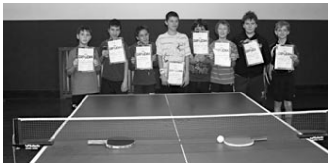
1. - 3. místo čtyřhra žáci