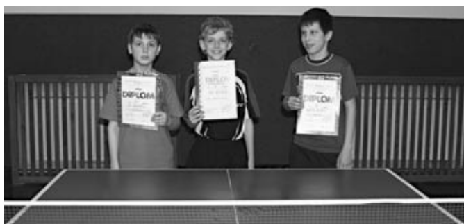
1. - 3. místo dvouhra - žáci