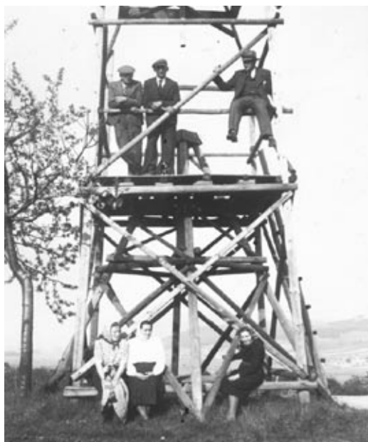
Triangulační věž na Brusné – kolem r. 1950