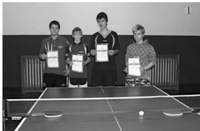
1. - 2. místo čtyřhra - dorost