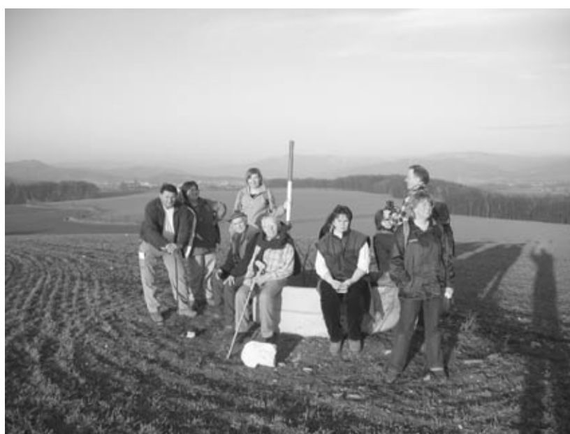
Vrchol Brusné – jaro 2008