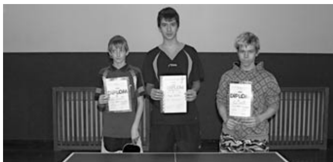
1. - 3. místo dvouhra - dorost