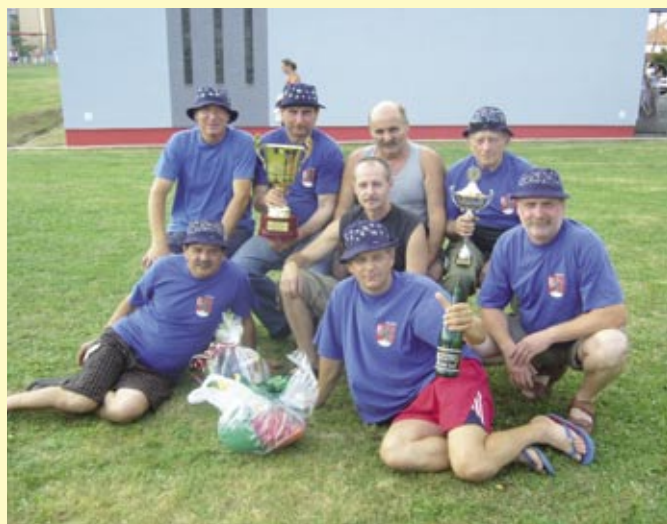
Na hasičské soutěži 27.8.2011 ve slovenské Lehotě pod Vtáčnikom vybojovali bludovští veteráni 1. místo.

Ve dnech 19.8.2011 – 28.8.2011 jsme se zúčastnili dovolené v Chorvatsku v Podaci se společností Bludovská a.s.