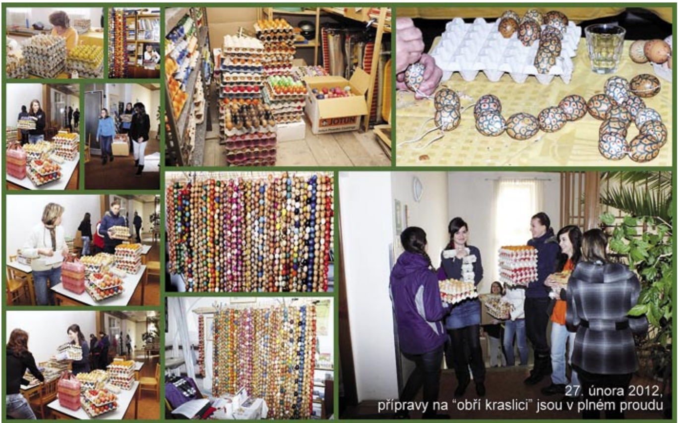
27. února 2012, přípravy na "obří kraslici" jsou v plném proudu