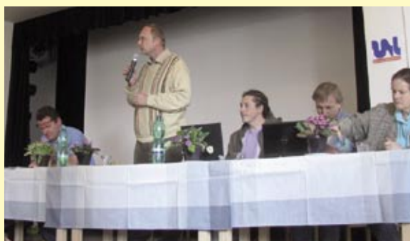
Předsednictvo Sněmu ČSOP