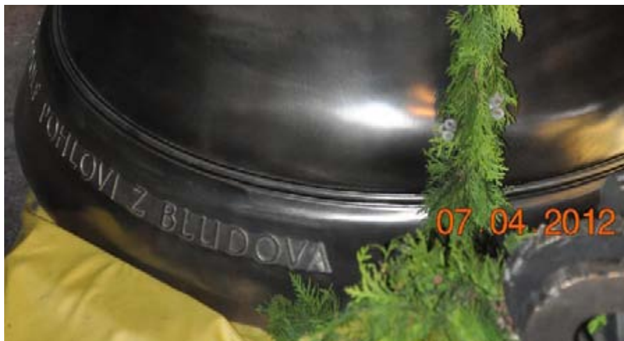
Detail z textu o donátorech na zvonu DOMINIK.