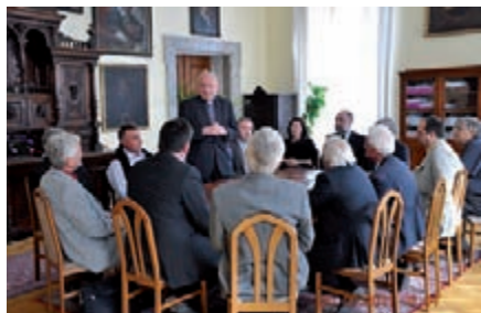
Z jednání dne 20. 6. 2011 v Metropolitní kapitule u sv. Víta v Praze.

Nebývá tak často, abych sledoval události dne v Televizních novinách. Ale z domácích událostí dne 11. ledna 2011 mě zaujala reportáž s účastníky návštěvy korunovačních klenotů, jejichž diskuse vyústila v nutnost obnovy varhan a doplnění původního počtu sedmi zvonů, z nichž v té době byly v katedrále svatého Víta, Václava a Vojtěcha v Praze jen čtyři. Ostatní tři zvony byly zrekvírovány za I. světové války. Bylo hovořeno o možné formě získání potřebných finančních prostředků např. cestou sponzorů či sbírky, vyjadřující sounáležitost občanů s katedrálou, k čemuž vyzval sám arcibiskup Dominik Duka. Tyto informace byly pro mne v otázce cíleného sponzorství, o kterém jsem přemýšlel od prodeje akcií, poměrně zásadní.