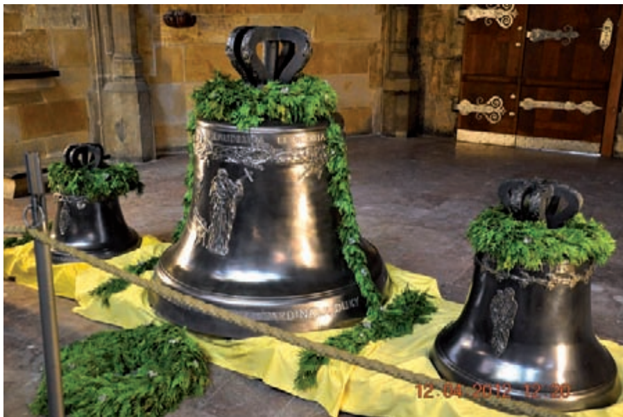
Vystavení nových zvonů v katedrále sv. Víta, Václava a Vojtěcha v Praze, zvon DOMINIK uprostřed.