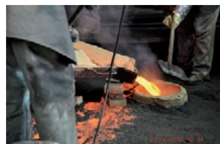
Dne 29. 2. 2012 lití zvonu DOMINIK ve zvonářství v Brodce u Přerova