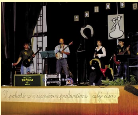
Country kapela Pracka