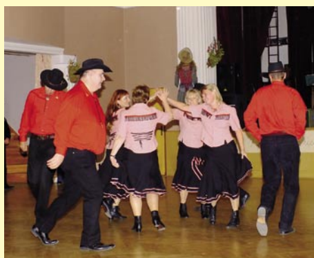
Old Country dance Šumperk