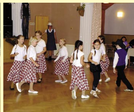
Základní škola Bludov