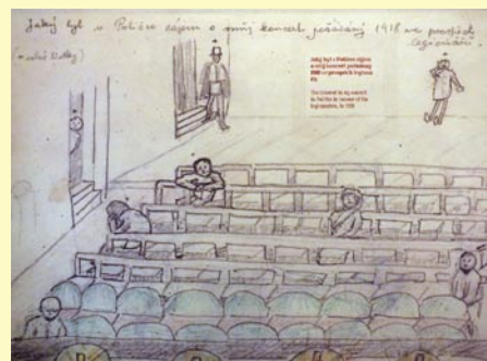
Kresba Bohuslava Martinů z roku 1918.