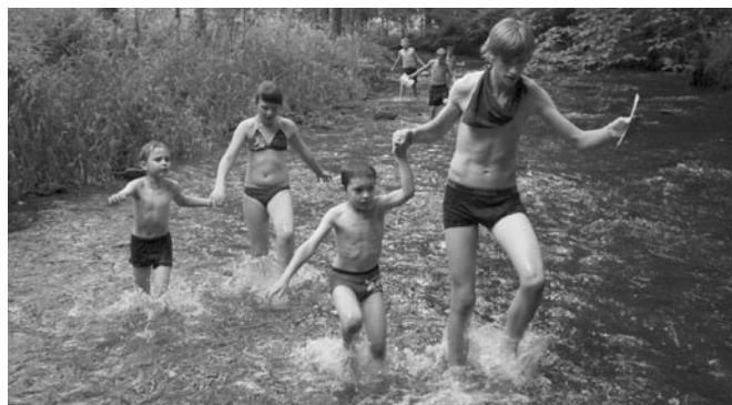
Etapa celotáborové hry