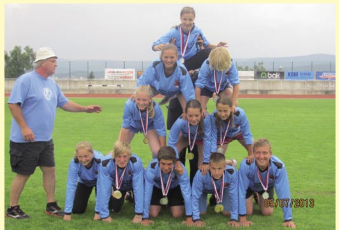
Družstvo st. žáků SDH Bludov - MČR Jablonec nad Nisou 2013