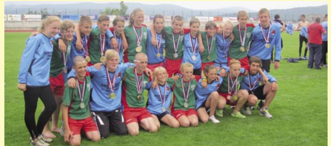
Největší soupeři - největší kamarádi SDH Bludov - SDH Těškovice / MČR Jablonec nad Nisou 2013

disciplíny se nakonec staly pro celkový výsledek rozhodujícími. Odpoledne proběhlo slavnostní zahájení a po jeho skončení probíhaly obě disciplíny CTIF.