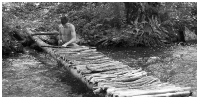
Vznikající most přes Březnou a br. Peťulka