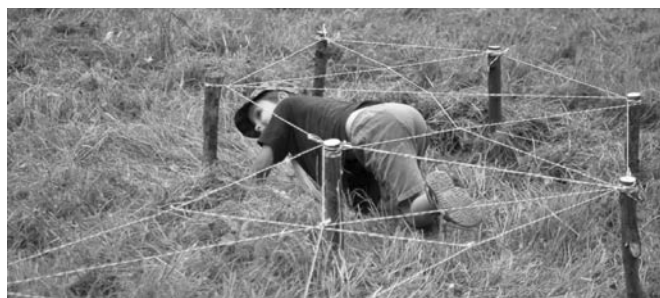
Jeden ze závodů