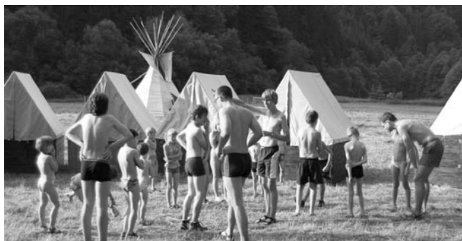
Ranní rozcvička v plavkách