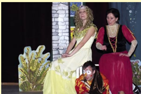
Pohádka O ZLÉ KRÁLOVNĚ, 12. 1. 2014