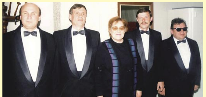
Koncert ruského vokálního kvarteta nevidomých, rok 1996