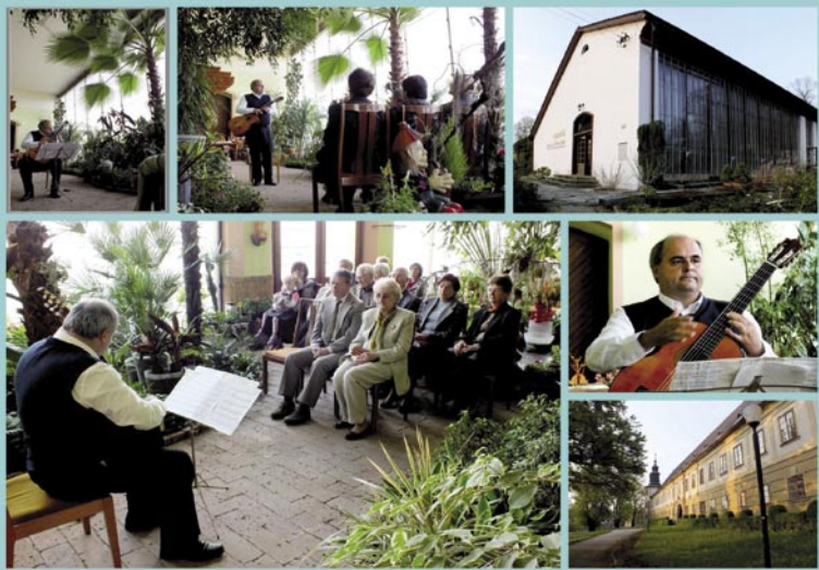
Kytarový koncert, rok 2011