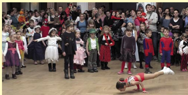
Maškarní karneval, 26. 1. 2014