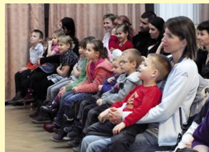
Pohádka o krtečkovi a myšce, 16. 2. 2014