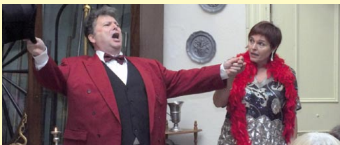
Procházka vídeňskou operetou, rok 2013