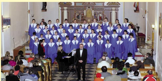
Adventní koncert MOTÝLI, rok 2012