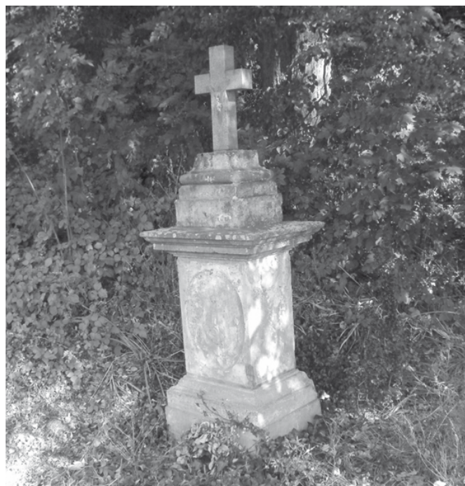
Obr.č.2: Stávající pískovcový podstavec na Nádražní ulici.

Děkuji za jakoukoliv informaci k této věci.