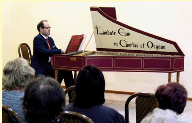
16.10.2016 Koncert KPH - Hroch