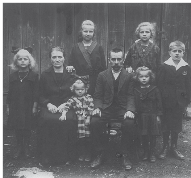
Rodina Jana Ploda