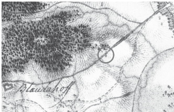
Obr.č.1: Mapa vojenského mapování kolem roku 1768.

Chceme touto cestou poprosit vás, kteří v této věci víte něco bližšího, zda byste nám mohli poskytnout informace.