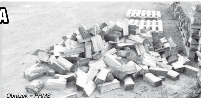
Obrázek = PRMS