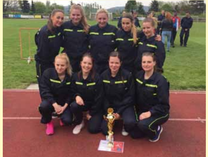
Družstvo žen SDH Bludov