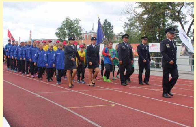
slavnostní nástup MČR Zlín Mladí hasiči