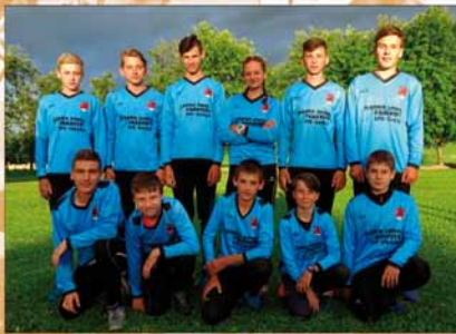
representace mladých hasičů