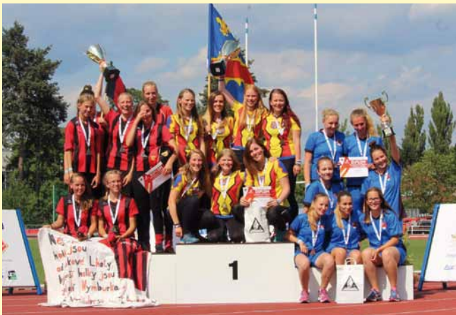
dorostenky MČR Zlín