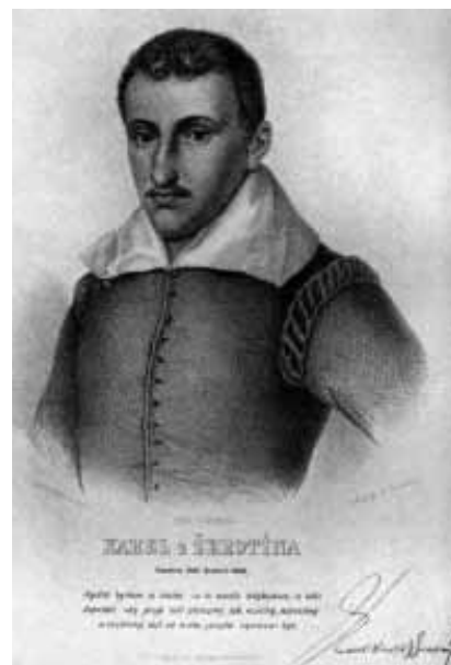
Karel st. ze Žerotína

třinácti osob (možná patnácti) byly umístěny do jedné dubové rakve, mezi nimi tedy i nejslavnější Žerotín, velký Moravan Karel starší, jeho oba rodiče, babička, tři manželky (mj. sestra Albrechta z Valdštejna Kateřina) a další. Obyvatelé Brandýsa nad Orlicí litovali převozu ostatků – 8. listopadu 1842 je vyprovázelo celé město, zvuky hudby a zpěv písně za tím účelem složené, jež již jedna sloka zněla: „Proč pak se od nás ubíráš, předrahy Žerotíne? Měj se dobře v zemi jiné, když opouštíš nyní nás, vzpomeň sobě, Žerotíne, na Brandejs v Bludově zas.“ Cestou do Bludova lidé ostatky slavnostně zdravili. O tom, že by v Bludově byly nějak slavnostně uvítány, informace nemáme. Do hrobky byly uloženy 10. listopadu 1842; koneckonců i pamětní deska je nadmíru skromná: „Zde odpočívají kosti Jana z Žerotína, zemř. 28. únor 1583, Karla z Žerotína, zemř. 9. října 1636 a příbuzenstva jejich.“