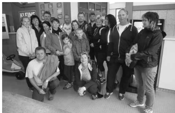
v krásných alpských výškách