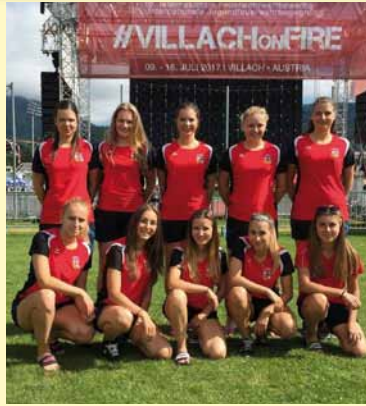
ženy SDH Bludov