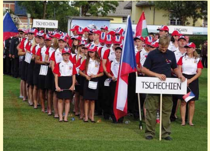
slavnostní zahájení olympiády