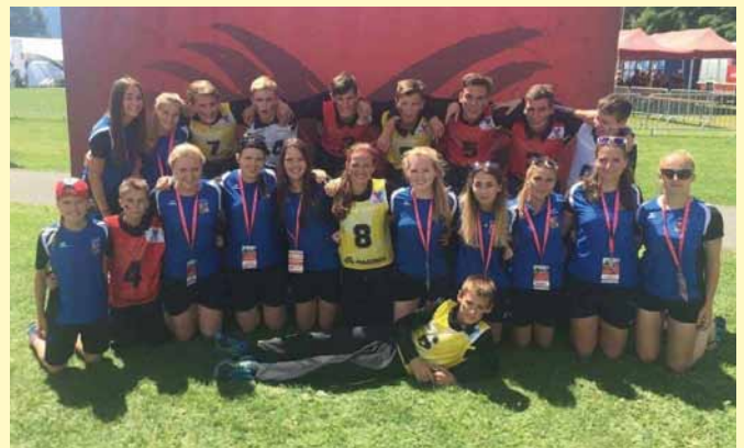
Villach - ženy a mladí hasiči SDH BLudov