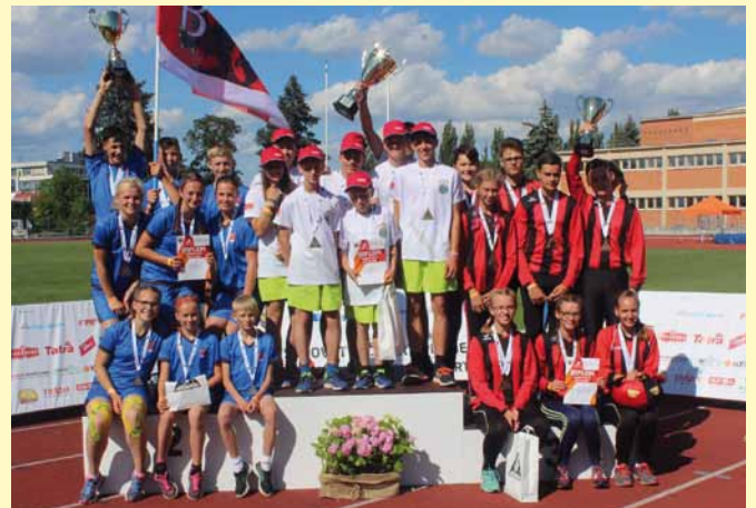
Mistrovství ČR Zlín mladí hasiči