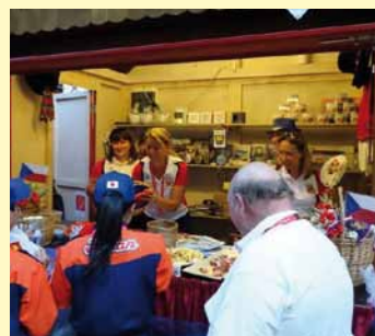
stánek České republiky