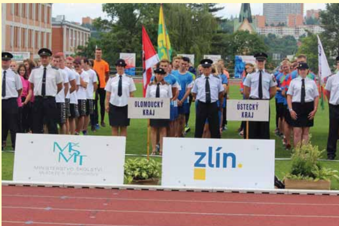
slavnostní zahájení MČR dorostu Zlín