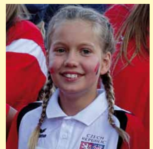
Olympijská vítězka Vendula Jílková