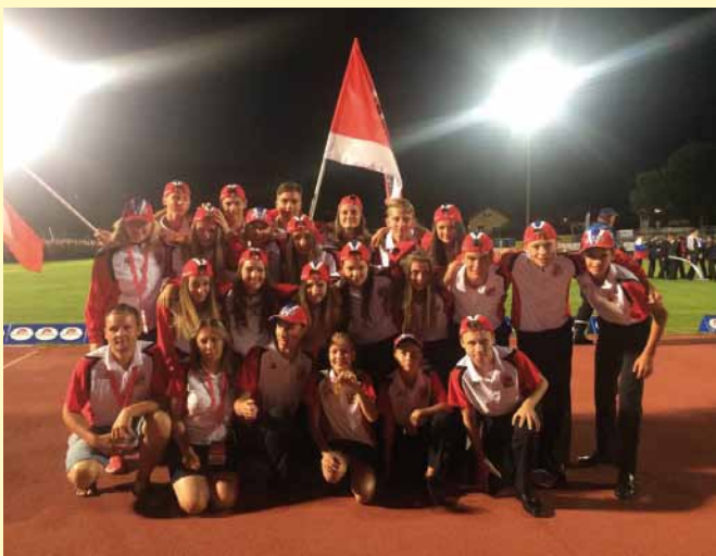
Olympiáda Villach červenec 2017