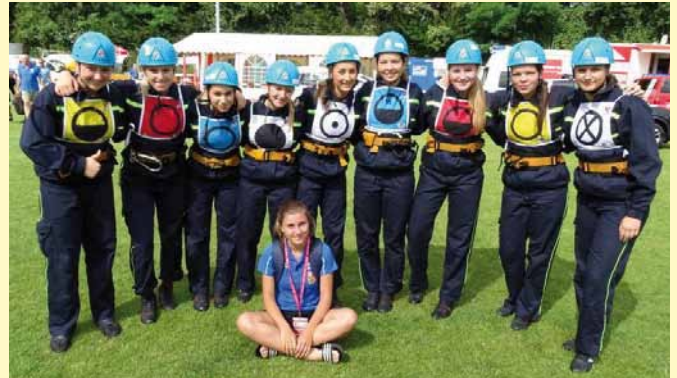
Villach - ženy před závodem