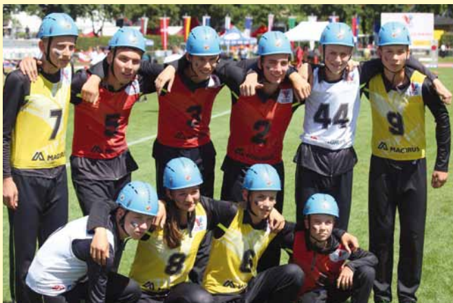
mladí hasiči před závodem na olympiádě