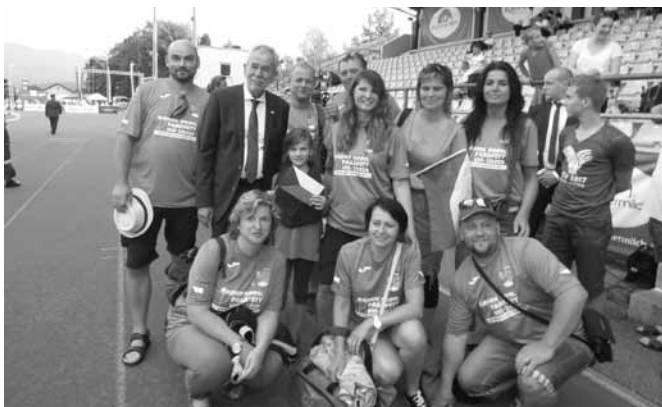
na stadionu s rakouským prezidentem