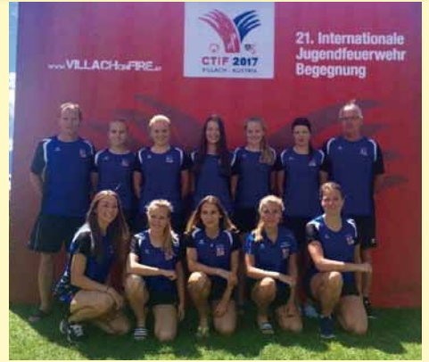
ženy SH Bludov