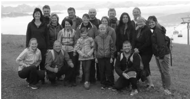
v krásných alpských výškách