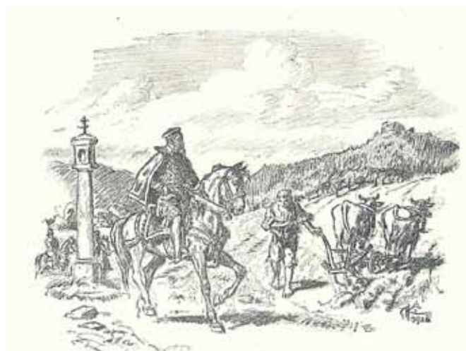
Bedřich z Žerotína oznamuje (r. 1565) bludovskému poddanému, že se zřiká odúmrtího práva v Bludově.

Máme tedy první zmínku o rychtě (první bludovský rychtář Marek se ale připomíná už v roce 1516), dále jasnou informaci o panském Čadovském dvoře, který byl velmi pravděpodobně základem Dolního dvora, a tedy pozdějšího zámku. Sedláci s příjmením Čadovský skutečně žili v Bludově v 16. a 17. století žili; není vyloučeno, že rod vymřel a odúmrtí přešel na majitele panství, který si jej nechal (podle nejstarší pozemkové knihy víme, že Čadovští vlastnili přinejmenším dva statky, přičemž u jednoho z nich se rod ztrácí, u druhého dost možná změnil příjmení na Juřina). Jak bylo uvedeno, vymínil si Bedřich užívání tohoto dvora na tři roky. Zřejmě po uplynutí této doby byla na