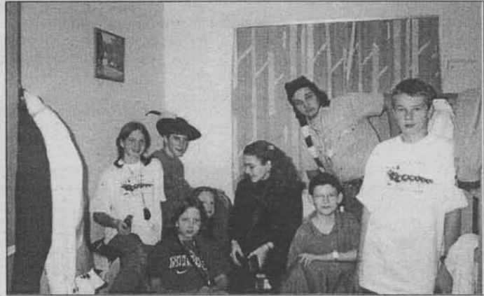
Část naší skupiny