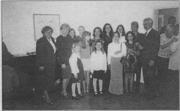
Z příjezdu na Českém velvyslanectví v Norsku