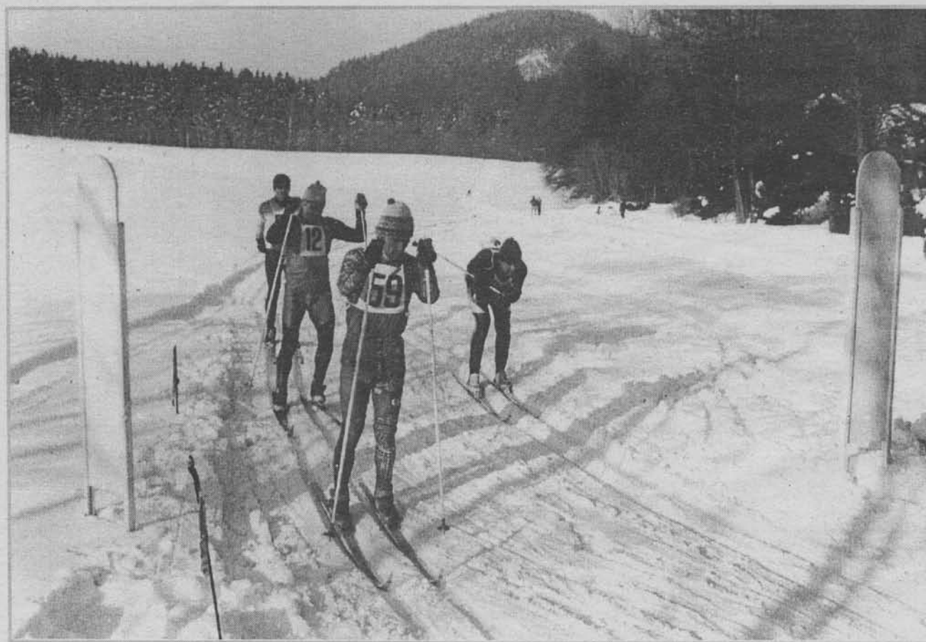
Závodníci vjíždějí do dalšího okruhu závodu.