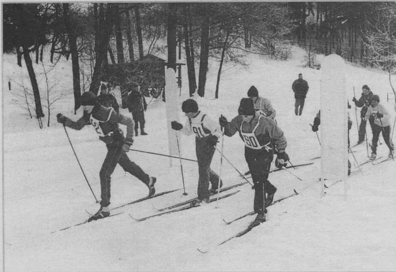
Start starších žáků a zákyň.