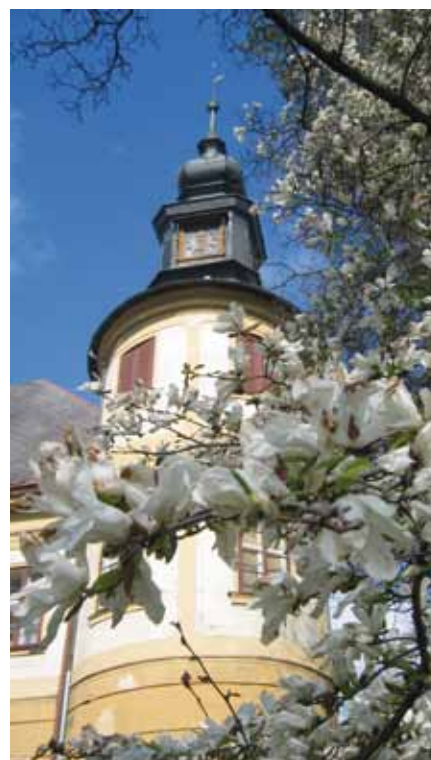
„1. máj roku 2006“