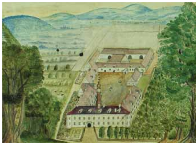
Podoba bludovského zámku před poslední velkou přestavbou v roce 1741 – se středovou věží a posunutým hlavním vjezdem