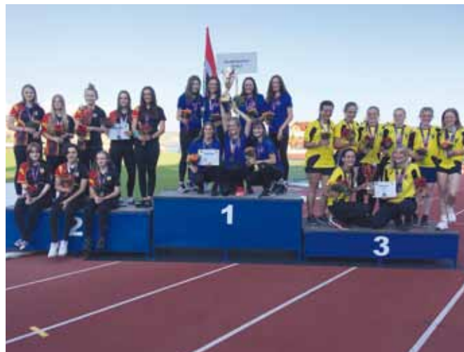
Dorostenky mistryně ČR.

Jednotlivé okresy se snažily mnoho dorostu dát dohromady z různých sborů, aby se mohlo závodit, a nakonec se to podařilo. Krajské kolo jsme v kategorii dorostenek i dorostenců vyhráli. Mistrovství ČR dorostu se uskutečnilo 3. – 5. července, a to na domácí půdě v Zábřeze. Pro nás pro všechny bylo tohle mistrovství velice náročné, protože ho nejen pořádali hasiči okresu Šumperk, ale na pomoci se podílelo mnoho členů našeho sboru. Říká se, že vyhrát na