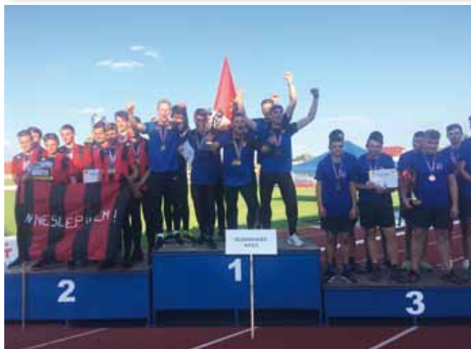
Dorostenci mistři ČR.