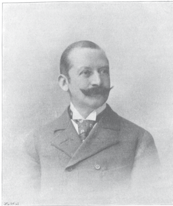
Excellenz Karl Graf Zierotin.

Jeho děti v roce 1905–1906 konvertovaly zpět ke katolické víře. V roce 1909 se Přemyslav ml. oženil s uherskou šlechtičnou. V roce 1912 se mu narodil jediný syn Ladislav Petr