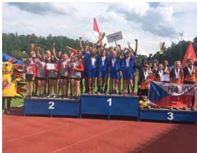
Mladí hasiči mistři ČR.

první čtyřka závodníků a zaběhla neuvěřitelný čas 39.09 s. Průběžné 1. místo. Při druhém pokusu této štafety nastupovala druhá čtyřka dětí a všichni na tribuně oněměli, když se na displeji zastavil čas 39,09 s. Neuvěřitelné, úplně jiné děti a naprosto shodný čas. Poprvé v historii se řešilo, že na stupně vítězů vystoupí všech 8 dětí z jednoho sboru. I přesto, že nás nakonec Zderaz posunul v této disciplíně na druhé místo,