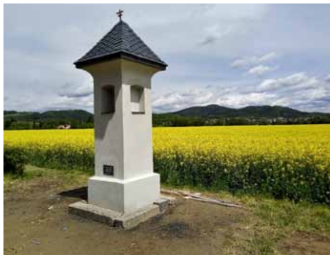
Bludov – Boží muka „U trati“ zdroj: turistika.cz

Viz převzatý snímek z internetu Roman Žalio