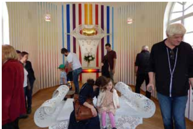
Nový interiér Kaple svatého Kříže.