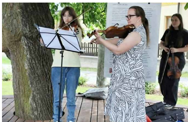
Hudební vernisáž v Galerii Adolfa Kašpara obohatily žákyně ZUŠ Šumperk.