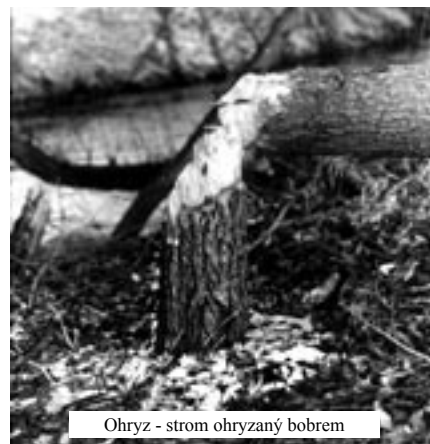
Ohryz - strom ohryzaný bobrem