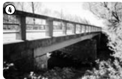
Most u bludovského mlýna