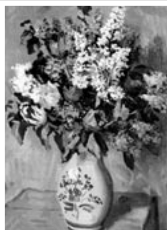
Šerík s tulipány, olej na plátně

Nyní můžete jeho obrazy a akvarely nejen obdivovat, ale milovníci umění si je mohou až do 12. června zakoupit.