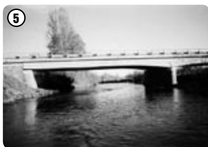
Most u Chromče