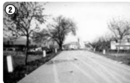
Vyhozený most u bludovského mlýna 1945