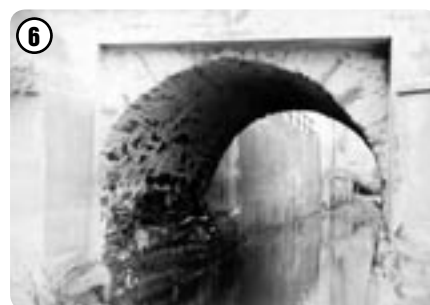
Přemostění náhonu u bludovského mlýna

u bludovského mlýna přes Vítóninský potok z r. 1962.