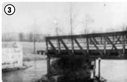
Vyhozený most u Chromče 1945