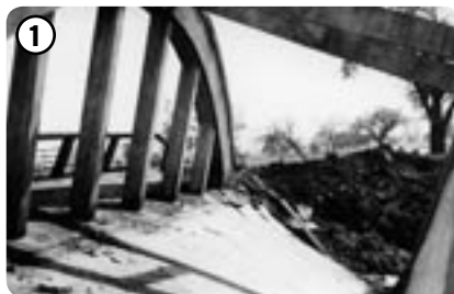
Vyhozený most u bludovského mlýna 1945

Posledními mosty, které má v Bludově ve správě Ředitelství silnic a dálnic ČR, správa Olomouc, je most č. 44-025 přemostňující mlýnský odpad a most č. 44-028