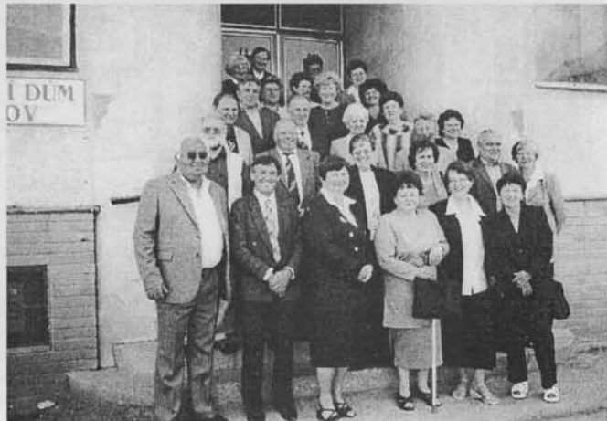
17. 5. 2003 setkání šedesátníků