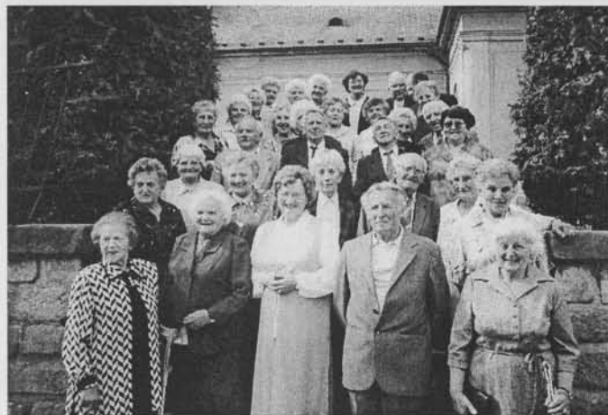
23. 5. 2003 setkání pětasedmdesátníků