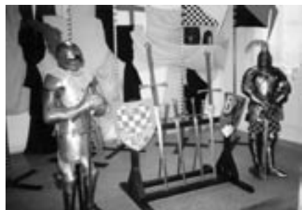
Výstava „Středověk“ v KD

Výstava historických zbraní a kostýmů, kterou zhlédla široká veřejnost, ale také žáci základních škol. Mottem této výstavy bylo seznámit veřejnost se způsobem života, odívání a zbraněmi 14. a 15. století.