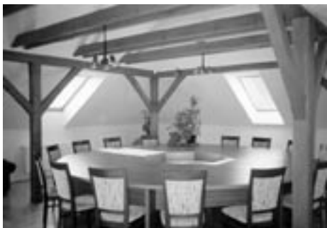
Současný interiér obecního úřadu – zasedací místnost a kancelář starosty