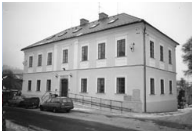
Budova po rekonstrukci