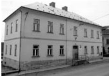
Budova staré školy před rekonstrukcí