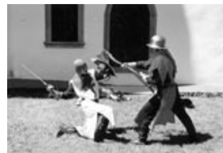
Vystoupení v Úsově