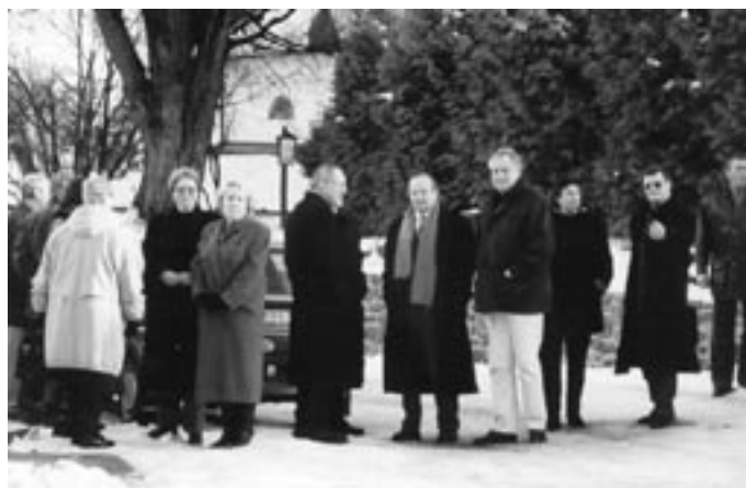
7. prosinec 2001 – slavnostní otevření radnice