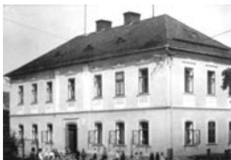
Stará škola 40. léta min.století