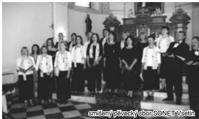
směšený pěvecký sbor SONET Vsetín