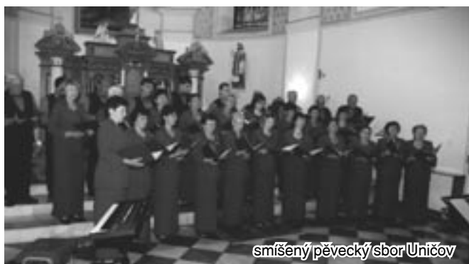
směšený pěvecký sbor Uničov