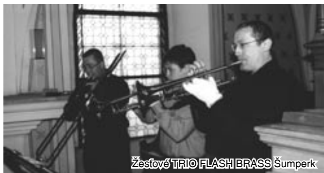
Žestové TRIO FLASH BRASS Šumperk