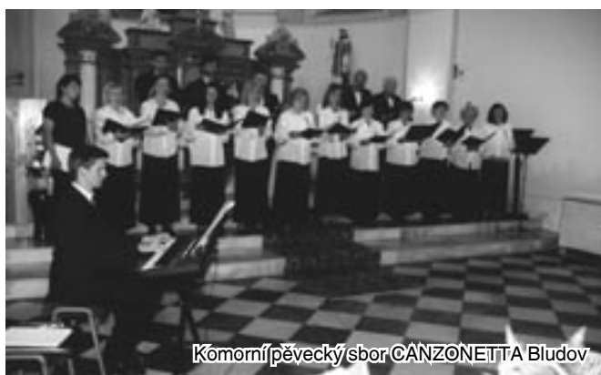
Komorní pěvecký sbor CANZONETTA Bludov