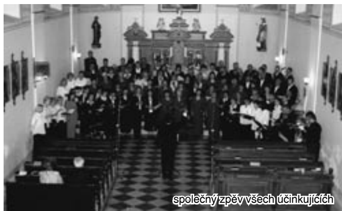
společný zpěv všech účinkujících