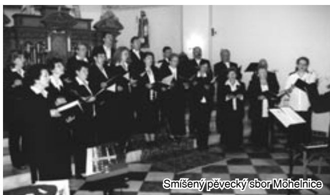
Směšený pěvecký sbor Mohelnice