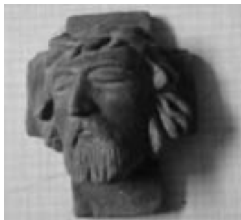
Plastika Krista vytvořená v kriminále z chlebového těsta

Přednáška byla poutavá a zajímavá. Příští rok chceme uspořádat zase obdobnou.