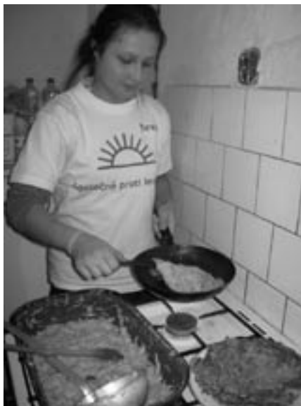
Jedna z členek olomoucké krajské výpravy při přípravě bramboráků, tradičního českého jídla.