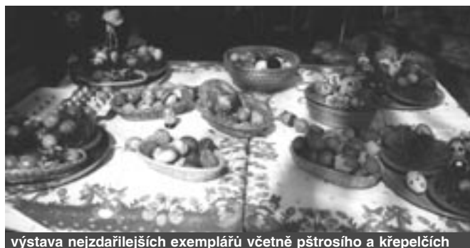
výstava nejzdařilejších exemplářů včetně pštrosiho a křepelčích

V rámci akce byla vyhlášena i soutěž o nejvíce nasbíraných kraslic, do které se zapojili hlavně žáci prvního stupně základní školy: