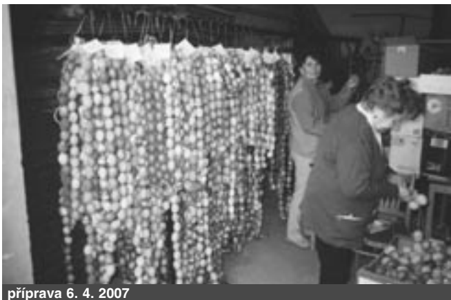
příprava 6. 4. 2007