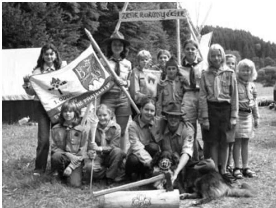
Dívčí oddíl na táboře v roce 2005

své klubovny. Zpočátku byli na zámku, později se dva oddíly přesunuly na četnickou stanici na statku čp. 38, druhý oddíl se usídlil v nedávno zbořeném domku, který patřil rodině Krušinských (v potokách).