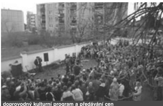
doprovodný kulturní program a předávání cen

Prvních 30 výherců bylo už odměněno, ostatní zde uvedení si mohou vyzvednout malou cenu v Kulturním domě Bludov.