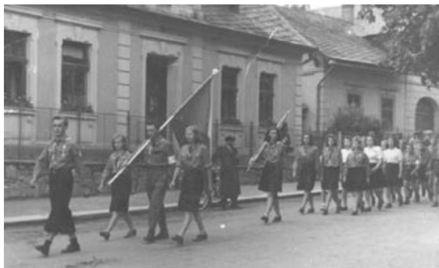
Průvod z kostela v roce 1945 po žehnání střediskové vlajky