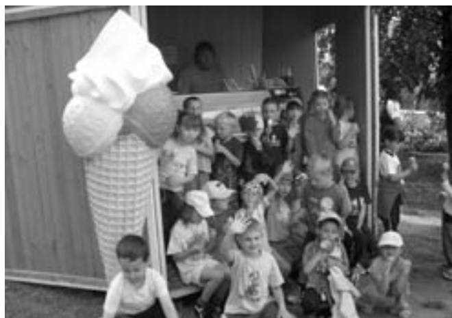
Pozvání na zmrzlinu od firmy Mikláš