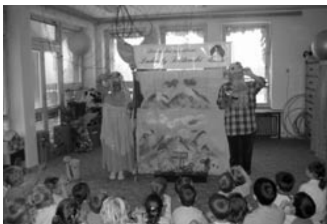
Divadelní představení Krakonošovy bylinky

Krásnou atmosféru a zážitky na školní zahradě přibližují fotografie.