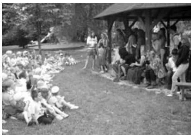
Bylinkové čarování III.