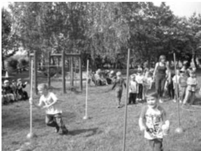
I. sportovní hry MŠ Olomouckého kraje