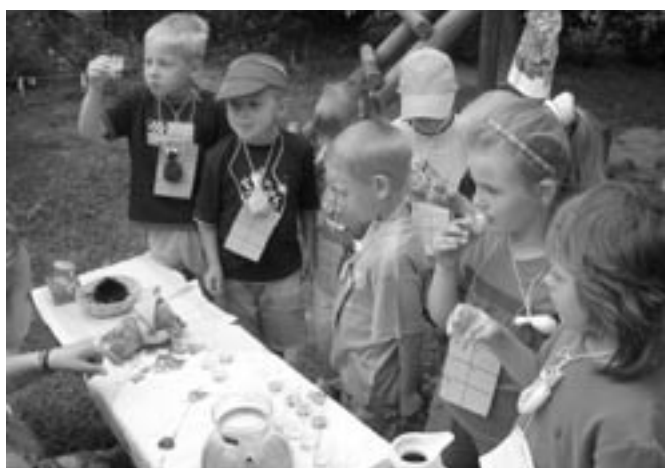
Bylinkové čarování II.