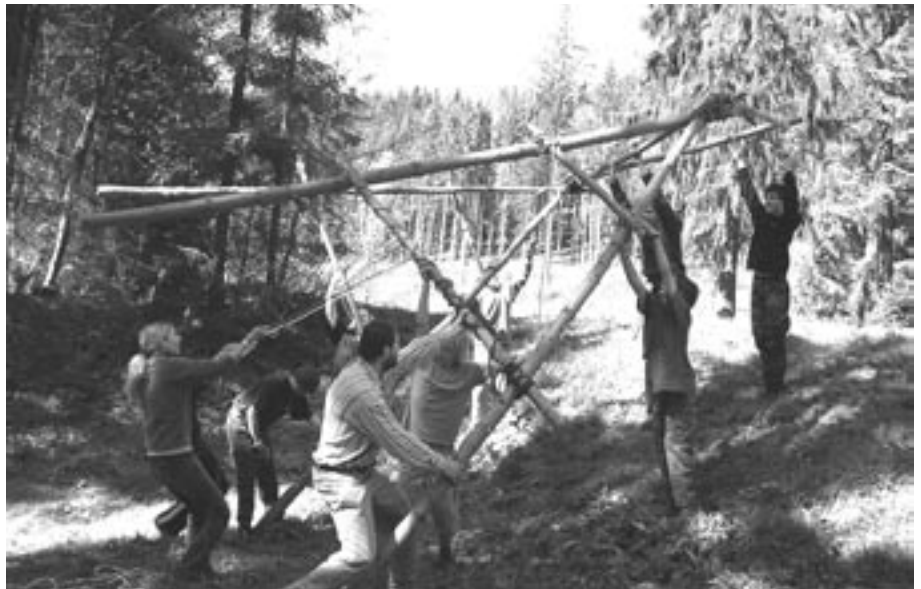
Mladí junáci si vyzkoušeli i stavbu vázané brány, se kterou budou reprezentovat na světovém jamboree v Anglii.