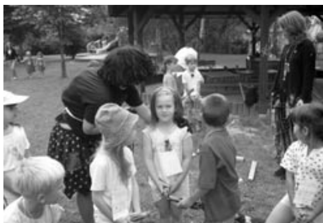
Bylinkové čarování I.