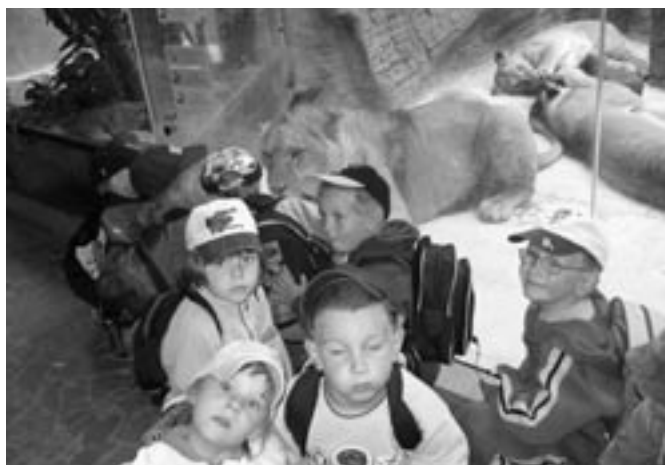
Na výletě v ZOO Olomouc