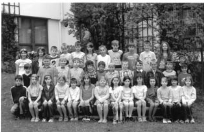
Základní škola Bludov, školní rok 2006 - 2007