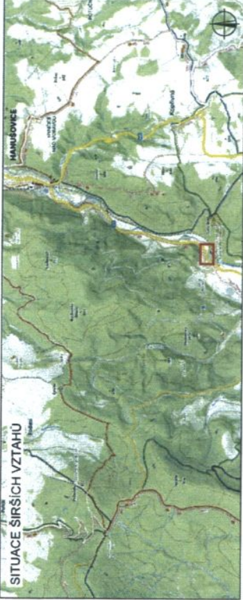
SITUACE ŠIRŠÍCH VZTAHU